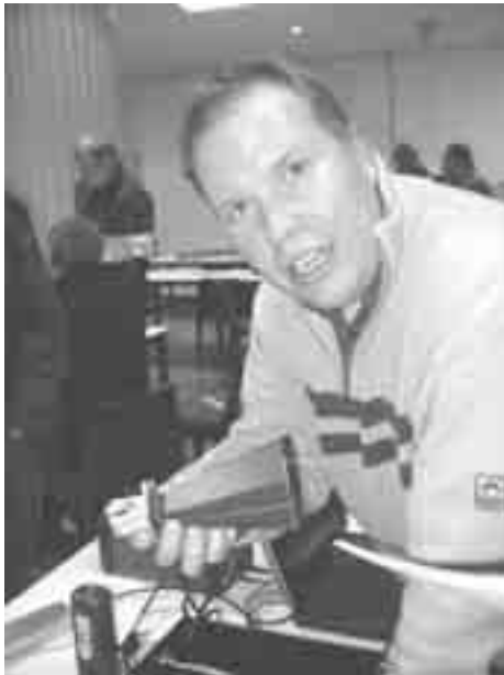
PA3FAW: Wees niet bang voor ATV