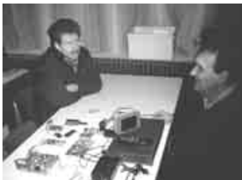
PE1ACB in gesprek ▼