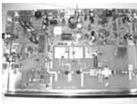
PE1ACB ATV zender