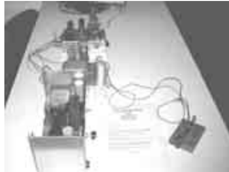
2m zender van wijlen PAØCAM ▲