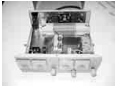
PA2HRJ antenne tuner zonder schakelaars ▲