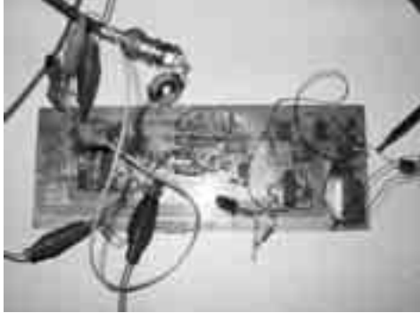
PA3FWM Een dsp ontvanger ▲ heeft nog hardware nodig