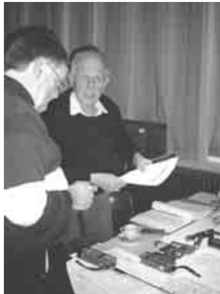
PA0BKI: Zo verbeter je de blauwe baksteen