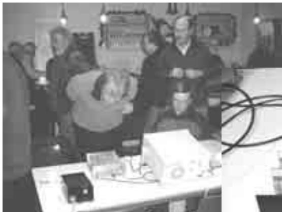
PAØDDB Automatisch hogere harmonischen filter ◀ ▼