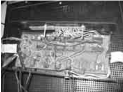
PA3EPQ Oude set voorzien van digitale uitlezing ▲