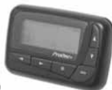
P2000 ProOne+ € 109,00

Verhuur van Portofoons Mobilofoons Repeaters