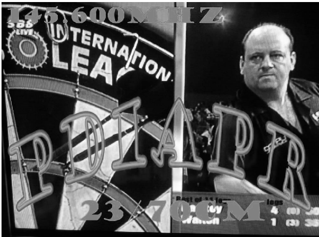
ATV-TESTBEELD VAN PD1APR VIA DE OMZETTER PI6TWE

De moraal van het verhaal is dat er hier in Twente genoeg controle op het imago beleid van de vhf en shf banden is.