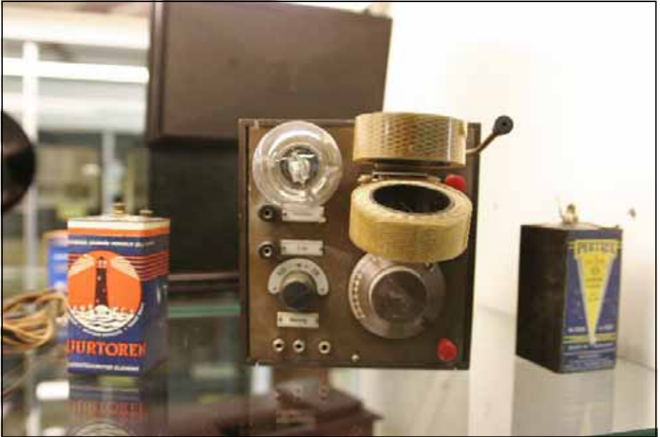
Hengelosche batterij van de vuurtoren en een oude otvanger