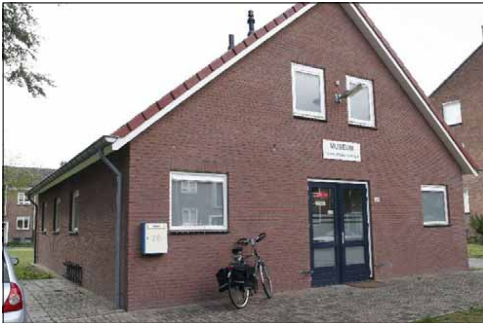
Het museum van buiten

Meer info is te vinden op: http://www.radiomuseum-hengelo.nl