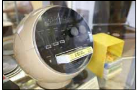
8 track speler