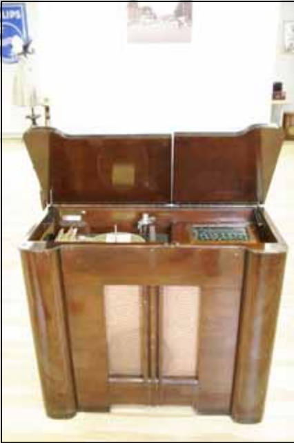
Radiomeubel van de baron van Twickel