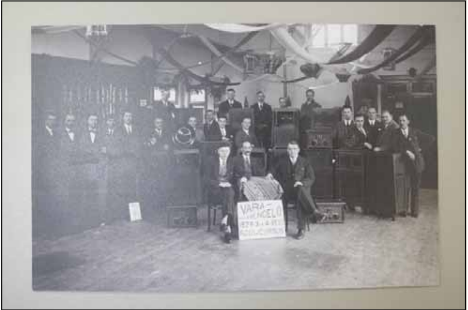
Leden VARA Hengelo bouwcurcus 1929 3-4 1930