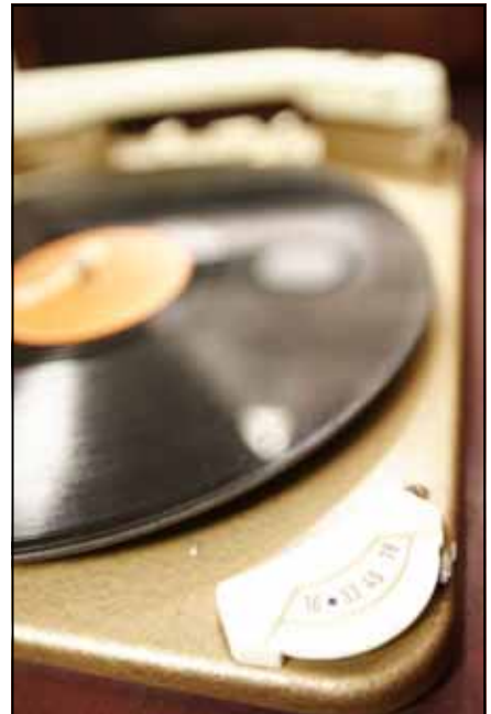
Ook voor 16 toeren geschikt