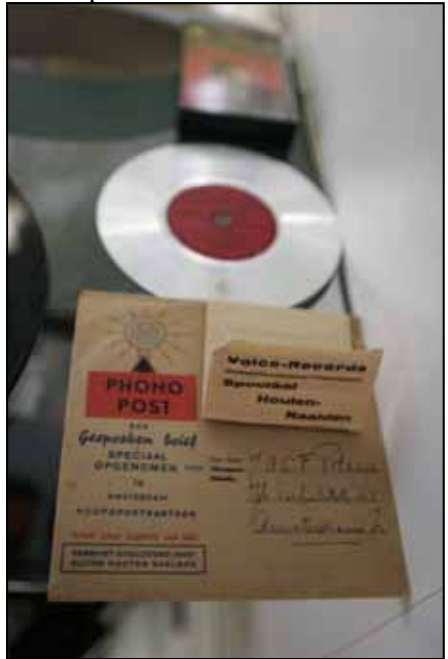
Phono post met houten naalden