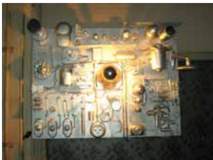
Deze mag er ook wezen