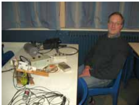
Battle Creek Special, antenne analyzer enz.