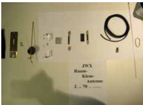
Commerciële zelfbouw van JWX