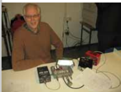
PA0GJV met zijn stack match