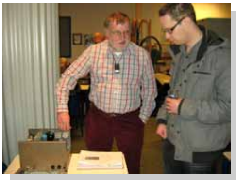
Het "tukkerje wordt alom bewonderd