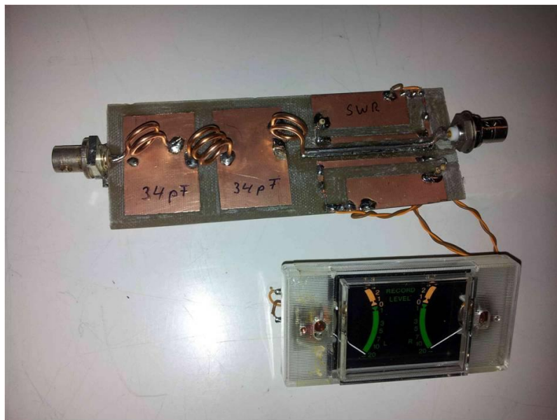
Foto van het zelfbouwsel van Chris PA0DDB / DL2DB. Eerst het filterdeel, daarachter de SWR-uitkoppeling

Uiteraard wilde Chris weten wat nu de demping is van het zelfbouwsel bij 145 MHz en bij de tweede harmonische van het filter. Chris was dan ook zeer verguld met het feit dat zijn zelfbouwsel als meetobject ingezet kon worden om het meetsysteem te kunnen uitleggen. Kort en bondig de volgende meetresultaten: