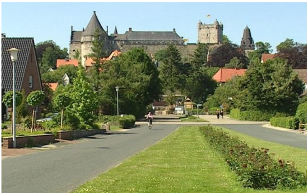
Het kasteel in Bad Bentheim