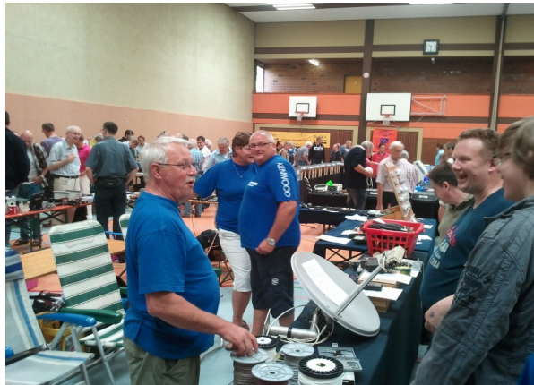
Gezellig even bijkletsen