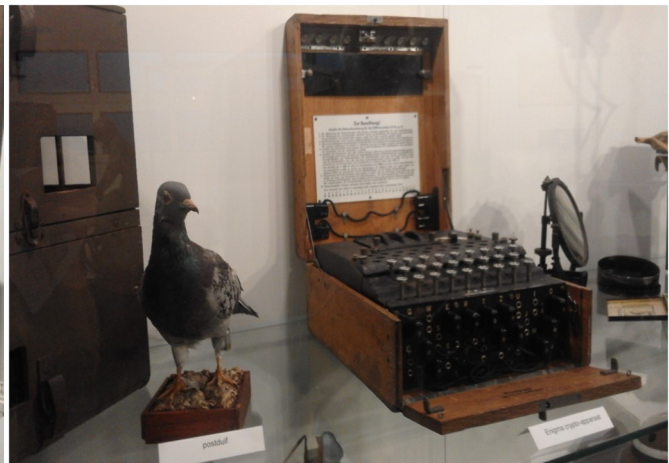
Zeer kostbare codeermachine Enigma